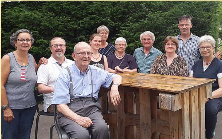
Treffen ehemaliger und aktueller Vorstandsmitglieder des ZFG

Von Herzen bedanke ich mich beim Stellenleiter an der Hirschmattstrasse für die Mithilfe beim Konsolidieren, für die Zusammenarbeit und Offenheit.