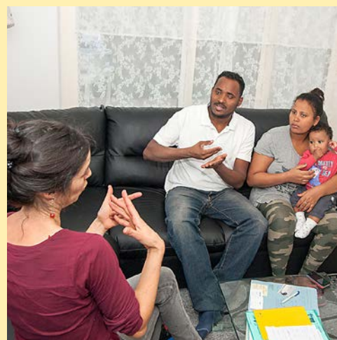
Der ZFG unterstützt die Finanzierung der SpF durch die BFSUG

diese Unterstützung sehr, da sie so die Gewähr hat, dass die Eltern ihre Informationen richtig verstehen und bei deren Umsetzung begleitet werden. Im Gespräch mit den Kindern werden Fragen ihrer speziellen Lebenssituation besprochen, und solche werden auch in der Schule bearbeitet, sodass die Kinder erfahren dürfen, dass die Hörbehinderung der Eltern ernst genommen wird und sie sich dessen nicht schämen müssen.